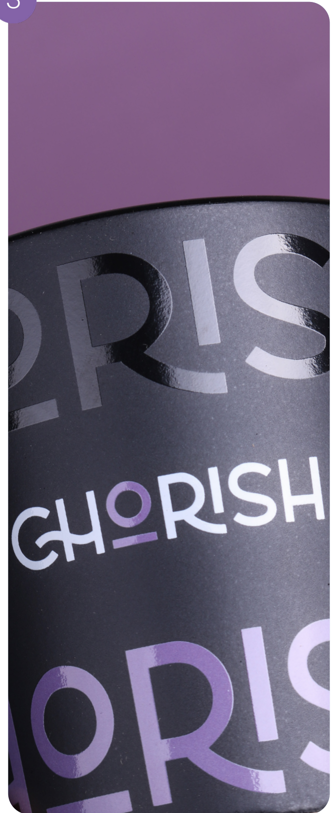
Innenfärbung und Dekordruck rund um den Becher (3 Farben)