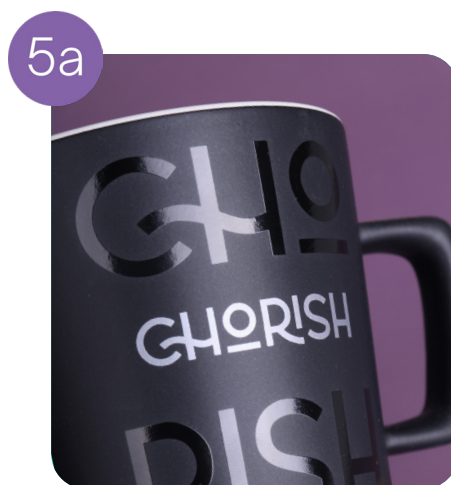
Einseitig bedruckt (silberfarben + schwarz)