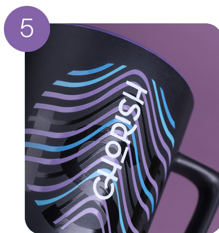
Vollflächiger Tassendruck + handgefertigt (5 Farben)