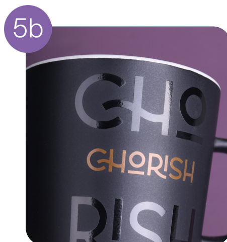
Einseitiger Druck (goldfarben + schwarz)