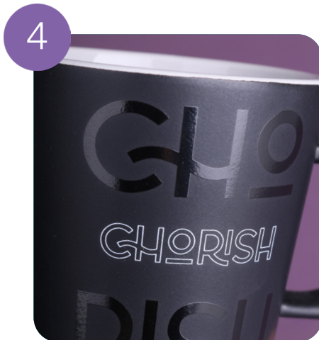
Einseitig bedrucken (2 Farben)