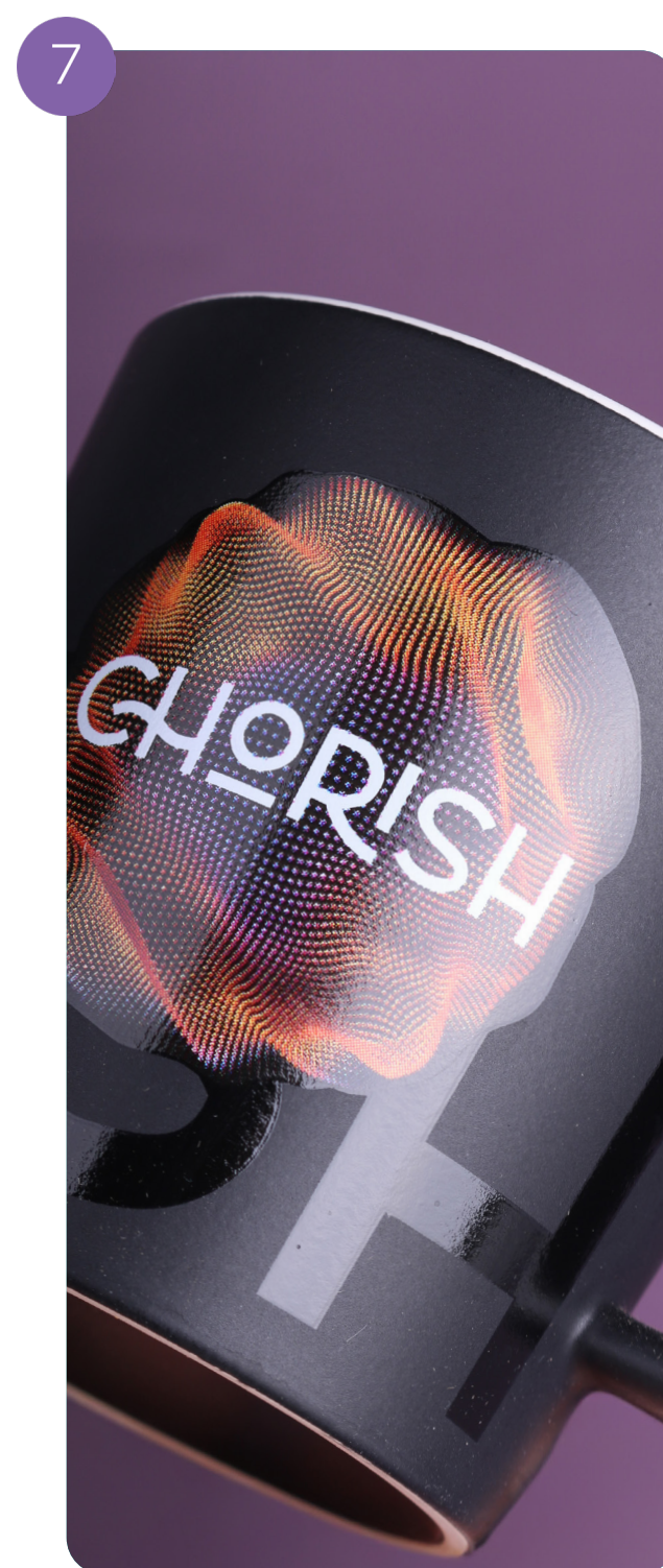
Organische Dekorelemente an den Rändern (CMYK + 1 Pantone-Farbe)