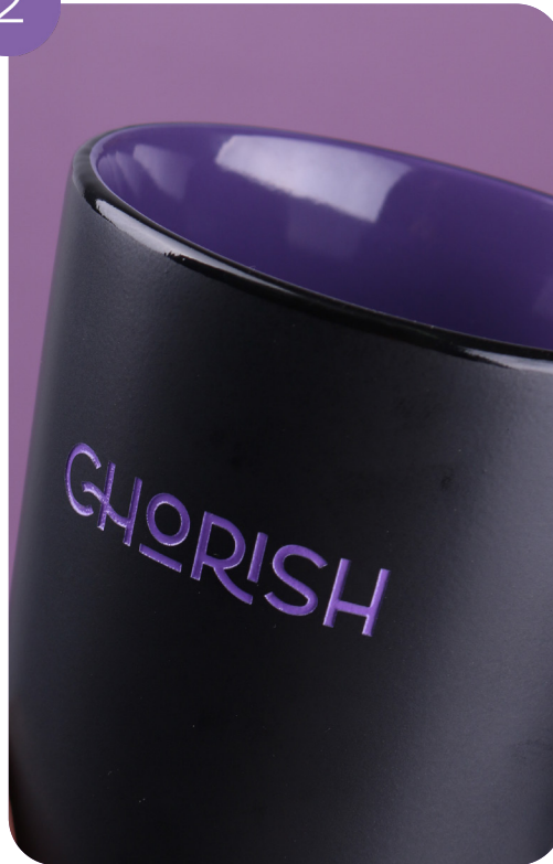
Innenbeize und Sandstrahlen (Tiefengravur) mit Farbfüllung