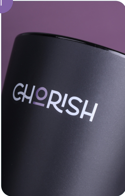
Innenfärbung und einseitiger Aufdruck auf der Tasse (2 Farben)